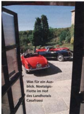
Was für ein Ausblick: Nostalgic-Flotte im Hof des Landhotels Casafrassi

Laos-Reise, Mitte der neunziger Jahre: Der Lichtmesser der Kamera war defekt, die Story geplatzt und Pichler so bedient, dass er das mit dem Fotografieren bleiben ließ.