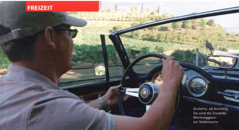
Giulietta, oh Giulietta: Da wird die Zitadelle Monteriggioni zur Nebensache