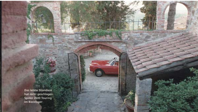
Das letzte Stündlein hat nicht geschlagen: Spider 2600 Touring im Basislager