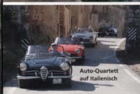
Auto-Quartett auf Italienisch