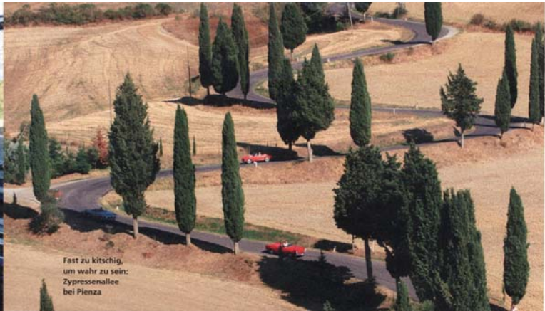
Fast zu kitschig, um wahr zu sein: Zypressenallee bei Pienza