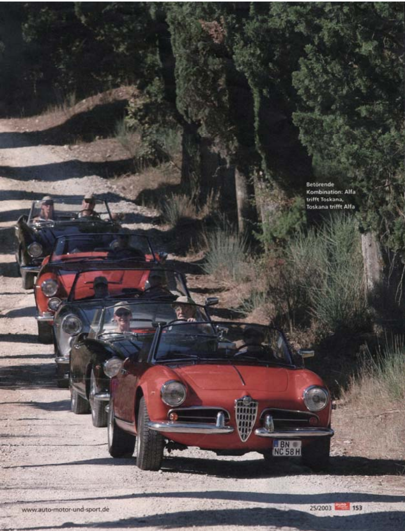
Betörende Kombination: Alfa trifft Toskana, Toskana trifft Alfa